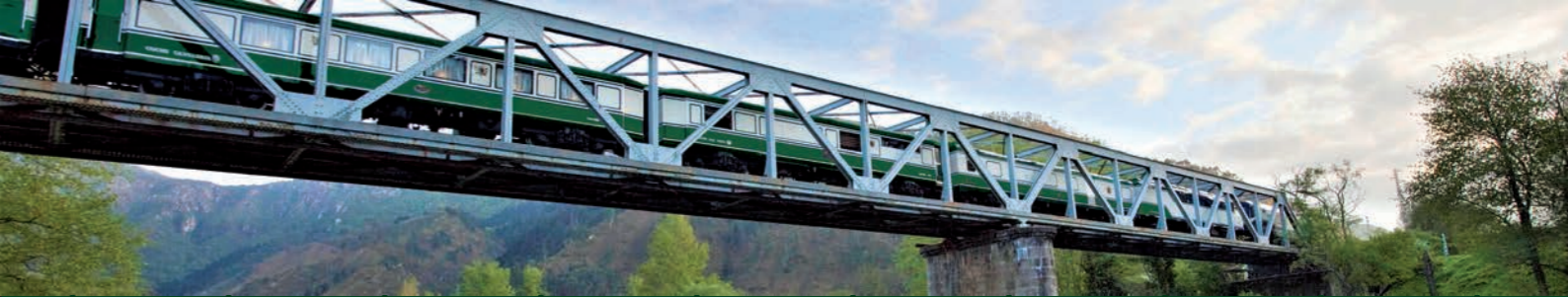
Tren de Lujo